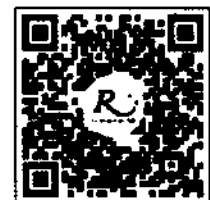
QR-Code สำหรับจองห้องพัก โรงแรม รอยัลริเวอร์

การสำรองห้องพัก ท่านสามารถจองห้องพักกับทางโรงแรมโดยสแกน QR-Code สำหรับจองห้องพัก หากท่านจองห้องพักภายหลังห้องพักอาจเต็มได้ และอาจจะไม่ได้ห้องพักราคาพิเศษซึ่งเป็นอัตราค่าที่พัก โรงแรมรอยัลริเวอร์ ๒๑๙ ซอยจรัญสนิทวงศ์ ๖๖/๑ แขวงบางพลัด เขตบางพลัด กรุงเทพฯ ๑๐๗๐๐ โทรศัพท์: ๐๒-๔๒๒-๔๒๒๒ โทรสาร : ๐๒-๕๓๓-๕๘๘๐ E-mail : rsvn@royalriverhotel.com