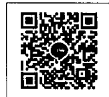
QR-Code เพื่อสอบถามข้อมูล